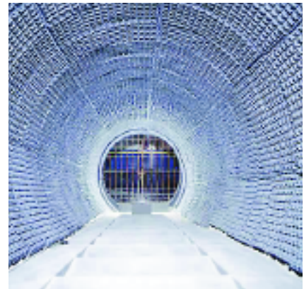
Túnel de absorción acústica

de música (en vivo o por reproducción) en departamentos vecinos, entre otras. En la mayoría de estos casos, el motivo de esta transmisión se refiere a inexistentes o inadecuadas bases antivibratorias, así como desacoples de los “periféricos” con el entorno.