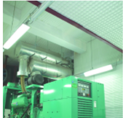
Tratamiento acústico en sala de máquinas