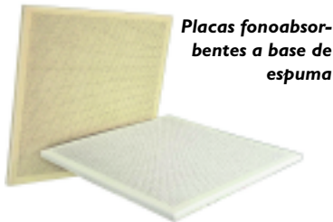
Placas fonoabsorbentes a base de espuma

Si fuéramos en cambio a los materiales cotidianos que funcionaran mejor como absorbentes sonoros respecto de otros, podríamos nombrar a las terminaciones “blandas” en general: cortinados, entelados, revestimientos de fibras, etc. Dentro de los desarrollados específicamente, las placas de cuñas anecoicas de poros abiertos resultan ser los de mejor resultado al momento de disminuir los problemas de reflexión en interiores.