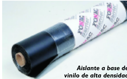
Aislante a base de vinilo de alta densidad

Ejemplos típicos podrían ser tabiques de hormigón, muros de mampostería maciza, maderas duras, etc. Dentro de los materiales acústicos específicos, las láminas de plomo o los polivinilos de alta densidad logran pesos importantes aún en espesores bajos.